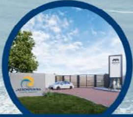
PÓRTICO DE INGRESO