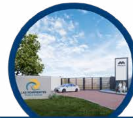
PÓRTICO DE INGRESO