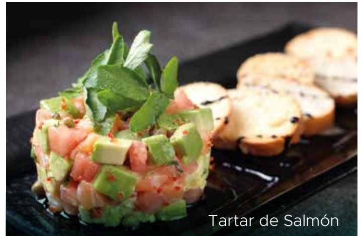
Tartar de Salmón