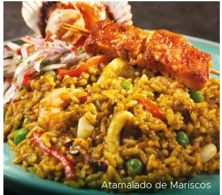
Atamalado de Mariscos